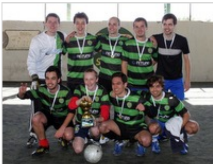
Obrigado Pablo

Nos dias 19 de junho e 3 de julho, na HD Sport Center - Centro Gaúcho, ocorreram as duas fases do campeonato de futebol do DACOMP 2011/1, coordenado por Gabriel Roletto Cardoso e Eduardo Mathias Tarouco. O tradicional campeonato é realizado todo semestre e os times são compostos por alunos, ex-alunos, professores e funcionários do Instituto de Informática. O campeonato do primeiro semestre de 2011 teve 15 times inscritos e foi patrocinado pela Wizard.